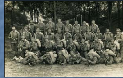
Etapní batalion č. 510 v Polsku