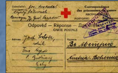
Psaní z válečného zajetí