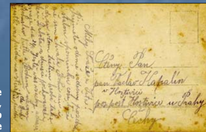
Bohuslav Horák poslal do Hostivice Václavu Kapálekovi fotografie, na niž je zachycen pohřeb padlého Drboty z Družce