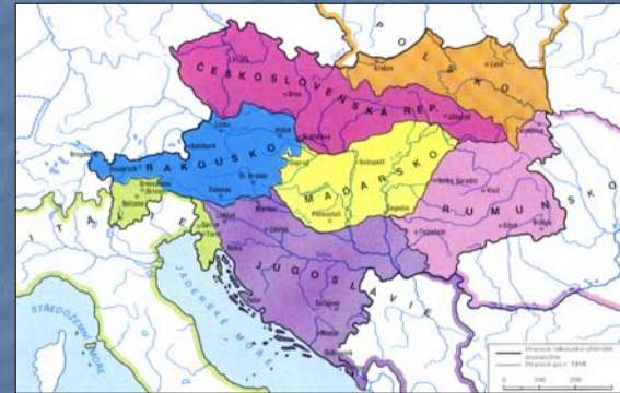
Rozpad Rakouska-Uherska na nástupnické státy v roce 1918