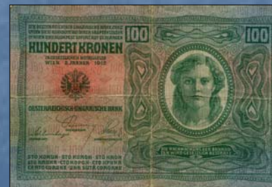
Rakousko-uherská stokoronová bankovka z roku 1912