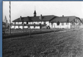
Sokolovna v pohledu z letního cvičiště