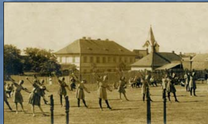
Cvičení sokolských žen v roce 1923