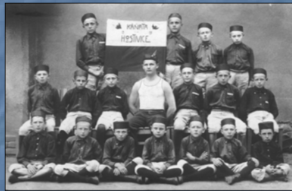
Dětský oddíl Sokola zvaný Káňata r. 1920