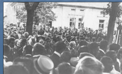
Slavnosti u pomníku padlých na Husově náměstí za 1. republiky