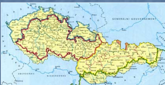
Správně uspořádání Československa během 2. světové války červeně je ohraničeno území Protektorátu Čechy a Morava