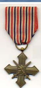
Československý válečný kříž 1939