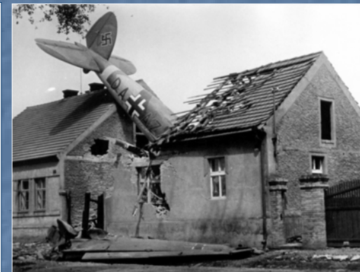
Německé letadlo Heinkel 111B spadlo 15. července 1941 do Jenečka

Přítomnost německého vojska pak při květnovém povstání v roce 1945 zkomplikovala osvobozování Hostivice.