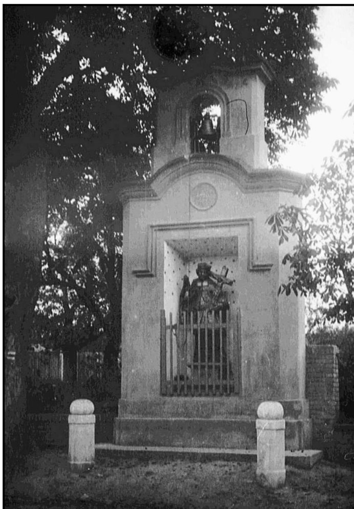
Kaplička na snímku z 50. let 20. století.