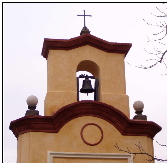
Zvonička v roce 2003 před poslední opravou a v roce 2004 po opravě.