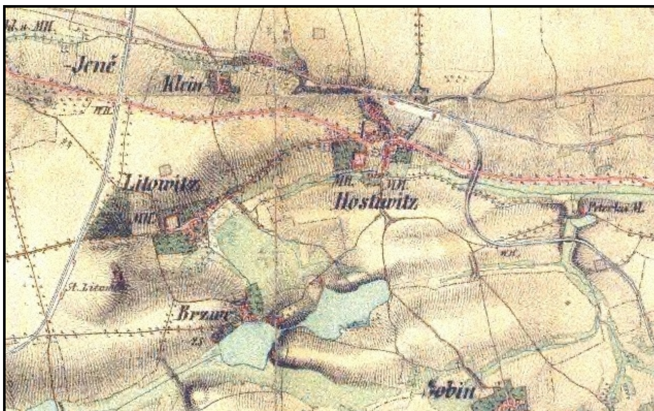
Hostivice na mapě 2. vojenského mapování z let 1839–1840 (převzato z http://oldmaps.geolab.cz )

Ve 40. a 50. letech 20. století se rozvoj výstavby zpomalil. Později vzniklo družstevní sídliště Na Pískách a rodinné domy vyrostly mezi ulicemi Ke Stromečkům a Břevská, na poli V Čekale i jinde. Vedle bývalého hostivického hřbitova vznikl areál mateřské školy a fotbalový stadion. Na místě bývalého hostince U Českého lva na Husově náměstí bylo postaveno nové nákupní středisko. Nová velká vlna výstavby přišla po roce 1989 a trvá dosud.