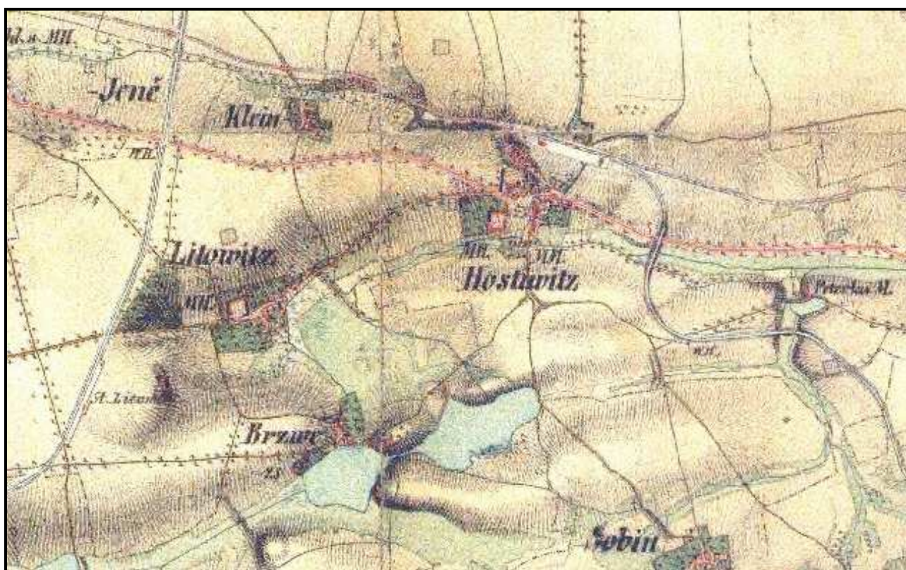
Hostivice na mapě 2. vojenského mapování z let 1839–1840.

Ve 40. a 50. letech 20. století se rozvoj výstavby zpomalil. Později vzniklo družstevní sídliště Na Pískách a rodinné domy vyrostly mezi ulicemi Ke Stromečkům a Břevská, na poli V Čekale i jinde. Vedle bývalého hostivického hřbitova vznikl areál mateřské školy a fotbalový stadion. Na místě bývalého hostince U Českého lva na Husově náměstí bylo postaveno nové nákupní středisko. Nová velká vlna výstavby přišla po roce 1989 a trvá dosud.