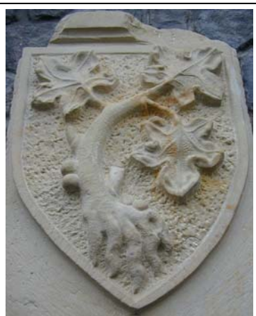
Erb Jana IV. z Dražic na mostě v Roudnici n. L.

Právo užívat městský znak mívala v minulosti města a městečka. Hostivice neměla městský statut a proto ani svůj znak. V roce 1950 bylo toto právo zrušeno a obnoveno až usnesením Národního shromáždění Československé socialistické republiky č. 109/1967 Sb., kterým se vydává Vzorový statut městských národních výborů. V části VII. je stanoveno: „Pokud není obecně stanoveno užívání státního znaku, mohou městské národní výbory, obvodní národní výbory a s jejich souhlasem i podniky a organizace na území města používat znak města. Znak schvaluje po vyjádření příslušného archivu plénem městského národního výboru, které také stanoví způsob jeho používání.“