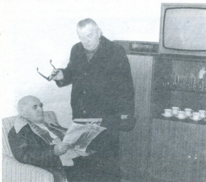
Klub důchodců v Hostivici, foto Miloš Šrámek.

Připravil jej náš národní výbor otevřením klubu důchodců v přízemí zámku. Stalo se tak ve středu 21. prosince, čímž bylo dáno do provozu poslední účelové zařízení, plánované v adaptované budově tohoto bývalého feudálního sídla. Klub důchodců se nachází v západní části zámku, v pěkné, klenuté místnosti, vybavené velmi slušným komfortem. Vedle moderní sedací soupravy jsou zde skříně s číšemi a šálky na kávu, stoly s židlemi, elektrický dvojvařič, rozhlasový přijímač a televizor. Nad klubem převzala patronát základní organizace Českého svazu žen v Hostivici I, jejíž členky se zde budou střídat v péči o návštěvníky vždy v pondělí a ve čtvrtek od 13 do 18 hodin, kdy bude klub otevřen. Důchodci mohou od nich dostat kávu, čaj, minerálku či limonádu, také donesený párek k svačině jim ohřejí. Ze sousední městské knihovny si mohou vypůjčit k přečtení denní tisk i týdeníky, mohou si poslechnout rozhlas či shlédnout televizní program. Časem zde budou organizovány přednášky a besedy s lékařem a jinými odborníky podle zájmu návštěvníků, především si zde však budou moci důchodci popovídat se svými vrstevníky, a tak tu v družném posezení trávit podle libosti svůj volný čas. Slavnostního otevření klubu se spolu s hostivickými funkcionáři zúčastnil i vedoucí odboru sociálních věcí a zdravotnictví ONV Praha-západ JUDr. Josef Janeček, který ve svém projevu vysoce ocenil péči našeho národního výboru o starší