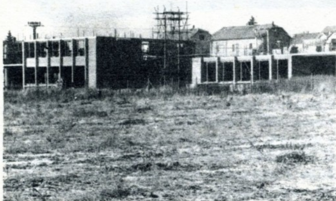
Stavba mateřské školy v Hostivici v závěru roku 1983

Říkáme zcela otevřeně, že jsme schopni dělat ještě více. Například ve výstavbě vodohospodářských akcí a místních komunikací, s jejichž stavem nejsme zdaleka spokojeni. Naše úsilí je však limitováno zejména finančními prostředky. A v tomto směru nebude situace lehčí ani v letošním roce. Nebudu věci příliš rozvádět, dovolím si pouze připomenout závěry prosincového zasedání ÚV KSČ. Zpráva předsednictva strany, přednesená s. Vasilem Bilakem, byla jasná a srozumitelná. Každý z nás jistě pochopí, že obrana a bezpečnost republiky vyžadují a budou vyžadovat nemalé prostředky, neboť žijeme v tak složitém období, v tak vyhocené mezinárodní situaci. I přes vážnost situace nejsme pesimisté a na řešení věcí v letošním roce se díváme realisticky. Budou dokončeny i rozpravovány další akce volebního programu a v řešení zásadních záležitostí postoupíme opět kupředu. Především bude dokončena výstavba čerpací stanice pitné vody pro naše město, čímž bude vytvořen zásadní předpoklad pro řešení složité situace s pitnou vodou.