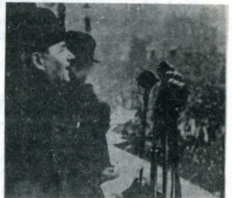
25.2 Přijetím demise reakčních ministrů a vytvořením Gottwaldovy obrozené vlády Národní fronty byla politická krize v CSR vyřešena.