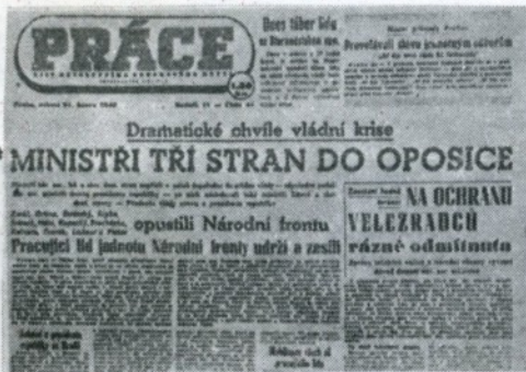
20.2 Demise ministrů tří stran-pokus o reakční puč.