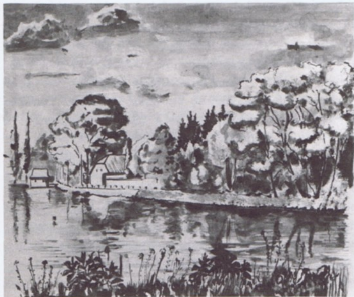
kresba Vladimír Stanislav