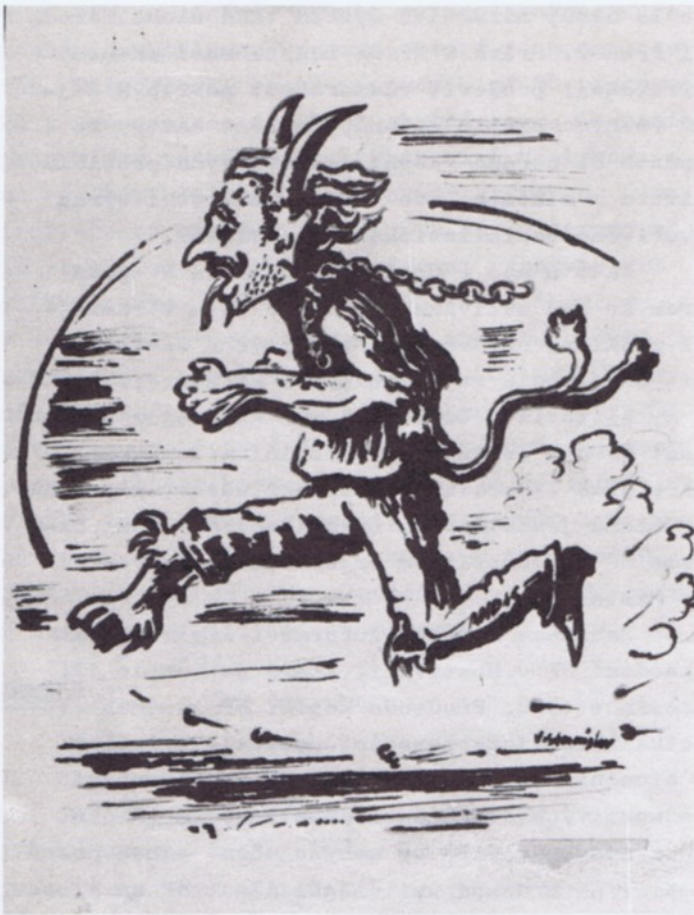
kresba Vl. Stanislav

Již s prvním sněhem se děti těšily na Mikuláše a na vánoční svátky. Než jsme se nadáli, byl tu svátek Barborky. Nařezali jsme větvičky třešní a "zlatého deště". Každý den jsme pozorovali, jak se větvičky probouzejí a pomalu rozkvétají. Ředitelství mateřské školy každoročně pozve Mikuláše a čerty s andělem do naší školy.