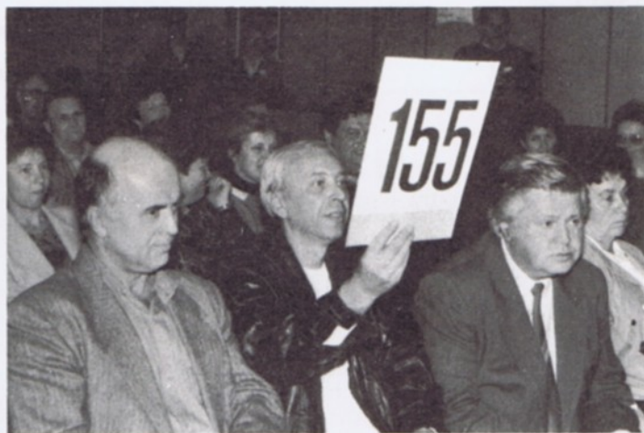
↑ Vydražitel a jeho resignující soupeř ↓