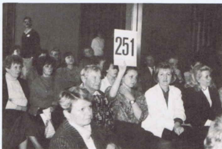
Napětí v sále Dělnického domu v Hostivici, kde v sobotu 27.4.1991 probíhala 1. aukce na okrese Praha-západ