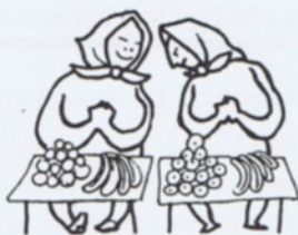
Budou-li spotřebitelé stále tak bíbí, staneme se co nevidět milionáři. KRESBA: ERVÍN ČERNÝ