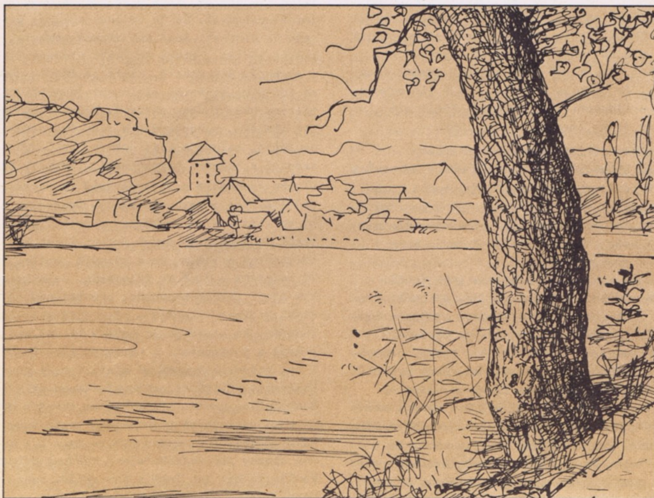
STARÉ LITOVICE V KRESBĚ JANA TURSKÉHO

PŘEČTĚTE SI: CO NÁM NEPŘEJE PAN STAROSTA • PŘEDVÁNOČNÍ ZASTUPITELSTVO A ZPRÁVY Z RADNICE • JÍZDNÍ ŘÁD NOVÉ AUTOBUSOVÉ LINKY • CO PATŘÍ NA SKLÁDKY, DO POPELNIC, KONTEJNERŮ A DO SBĚRNY • VÁNOČNÍ REMINISCENCE Z DÉLNICKÉHO DOMU, KOSTELA A ŠKOL • CENOVÉ RELACE V HOSTIVICI A V PRAZE • INFORMACE A NOVOROČNÍ PŘÁNÍ OBOU POLICIÍ • ZPRÁVY KRÁTKÉ A SNAD I AKTUÁLNÍ