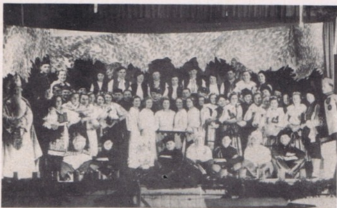
Tolik účinkujících bylo při šibřinkách 9. ledna 1937.

Němci. Tenhle nadšený Sokol cvičil nás kluky nevyčválané v žactvu a po cvičení rozložil na podlahu tělocvičny dlouhé pásy papíru. A pak na ně uhlem črtal oázu s palmami a velbloudy, pyramidy a sfingy, beduiny a lvy, štětce na dlouhém držadle vestoje maloval barvami, a my za ním lezli jako mravenci, podávali kelímky, štětce či uhel, občas něco zvrhli, umazali, roztrhli a přijali pohlavek pro povzbuzení, ale hlavně jsme "mrkali na drát", což to pan učitel zas vykouzlí. Velmi namáhavé bylo potom zavěšování kartónů na stěny sokolovny, zato dojem byl nezapomenutelný. Když jsem později účinkoval ve scéně Z luhů slovanských, poznal jsem to nezměrné nadšení a vytrvalost šedesáti účinkujících i těch, kteří to všechno připravovali - dekorace F. Hofman, osvětlení Z. Tomek, tance Vrzalová, Cílková, Tittelbachová, Saifrt Stan., Váchalová, klavír Saifrt Jos., orchestr řídil J. Kaplánek. Pravidelně se opakovaly besídky k nar. TGM, akademie k 28. říjnu, Mikulášské a silvestrovské zábavy s pestrým pořadem výstupů.