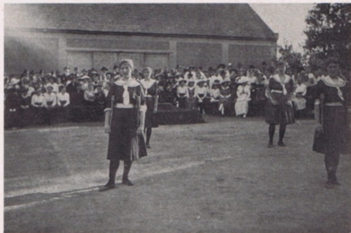
Veřejné cvičení na dvoře u Chlupatých v r. 1917. Nejstarší dochovaná fotografie z historie Sokola.