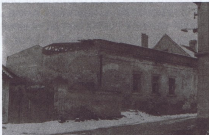
Budova sálu restaurace U Prchalů v zimě 1985

Díky každoročním výstavám a trhům získali chovatelé určité jmění a začali se zajímat o vhodné místo pro výstavbu chovatelského areálu. V roce 1980 vyjednávali se Státním statkem Jeneč a RaJ Praha - západ o koupi bývalé stodoly a zbořeniště sálu restaurace U Prchalů ve Starých Litovicích. Ke koupi došlo až v březnu 1982. Následující rok již chovatelé v upraveném areálu vystavovali dvakrát, v červnu a v září. Na jaře příštího roku pořádali prodejní trhy chovných i jatečných zvířat. Přitom ale pilně pracovali na přestavbě svého areálu. Letní výstavu v roce 1986 uspořádali chovatelé již v opraveném sále.