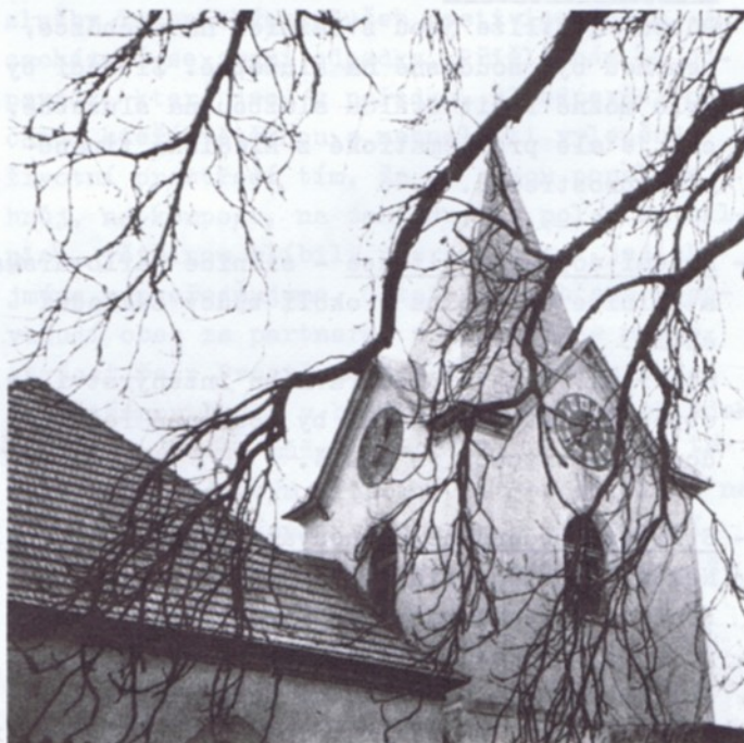
VĚŽ KOSTELA SV. JAKUBA JE DOMINANTOU MĚSTA

Obec Hostivice byla povýšena mezi města až dnem 1. ledna 1978. V dnešním rozsahu vznikla, až se postupně spojily původně samostatné obce Hostivice, Litovice, Břve, Jeneček a další část zvaná Palouky. O původním obyvatelstvu podávají svědectví úlomky nádob z mladší doby kamenné, které byly nalezeny při různých výkopových pracích. V historických pramenech je zmínka o hostivickém kostele sv. Jakuba ze 13. století. Sloužil přesídlencům, které tu usadil Přemysl Otakar II. při budování Malé Strany. Na jednom z dvorců sídlil rod pánů z Hostivice, který měl ve znaku tři stříbrné podkovy v červeném štítě. Potom se tu vystřídala celá řada majitelů. V 18. století vtiskla Hostivici charakteristický barokní ráz Anna Marie Toskánská stavbami zámku, fary a morového sloupu. V různých válkách Hostivici procházely a mnohdy tu i plenily různé armády. V 19. století usnadnilo Hostivici spojení s Prahou a Kladnem vybudování buštěhradské dráhy a dráhy ze Smíchova. Vedle státního statku a cihelny tu vznikla továrna na šrouby, na tvárnice i na stavební izolace, mlékárna a mlýn. Škola tu byla už od dob předbělohorských. Působil na ní také skladatel sokolské písně Lvi silou, František Pelz. Roku 1922 si Hostivičtí postavili sokolovnu, roku 1976 sportovní stadion.