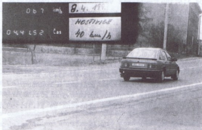
MĚŘENÍ RYCHLOSTI NA KARLOVARSKÉ SILNICI

Městská rada trvale sleduje práci komise pro posouzení nabídek budoucí smlouvy na zpracování územně plánovací dokumentace města.