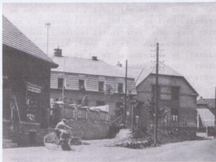
Dělnický dům - foto z roku 1928

UŽ není. Koho z nás, pamětníků počátků Dělnického domu by napadlo, že ho přežijeme! Jak se vyznat ve směsici dojmů, které vyvolával jeho vznik, existence i proměny za šedesát-seďm let?