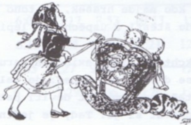
Ježíšku, miláčku, já Ti budu kolíbati, já Ti budu holíbat!

Přišli chudí pastuškové, zazpívali chvály nové: /: Vítej nám, andělský králi, tebe jsme dávno čekali, děťátko :/