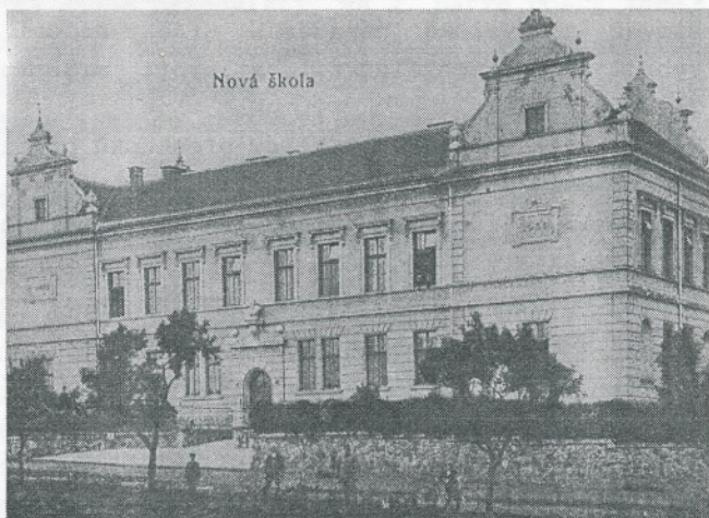
Hostivická škola v plné kráse.