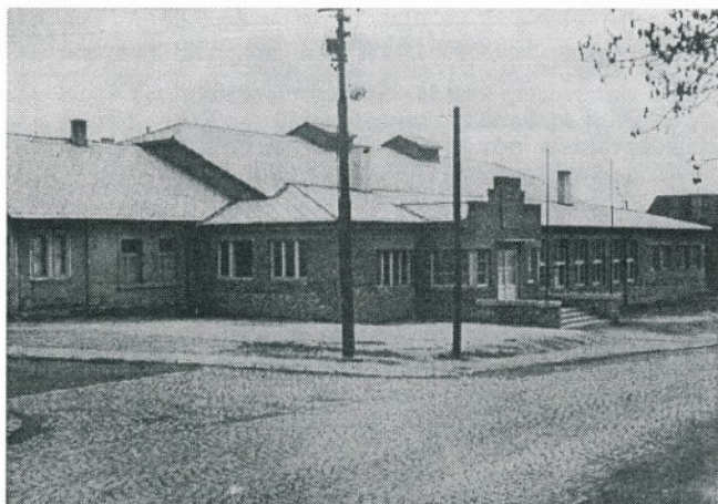
Sokolovna v období rekonstrukce a přístavby v letech padesátých