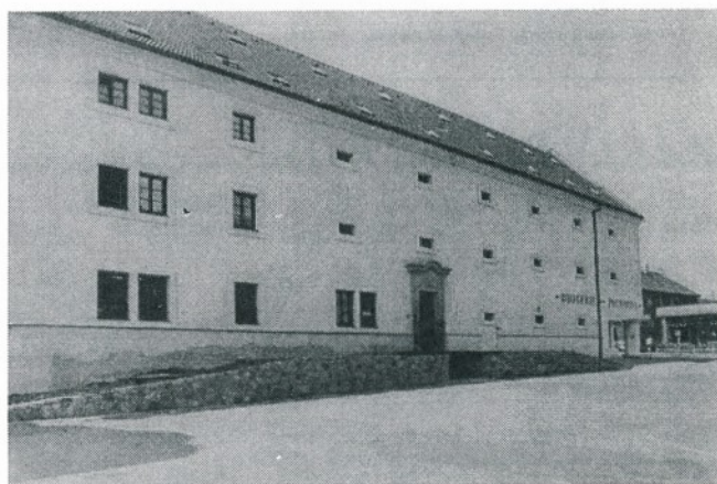
Ani špýchar už městu nedělá ostudu