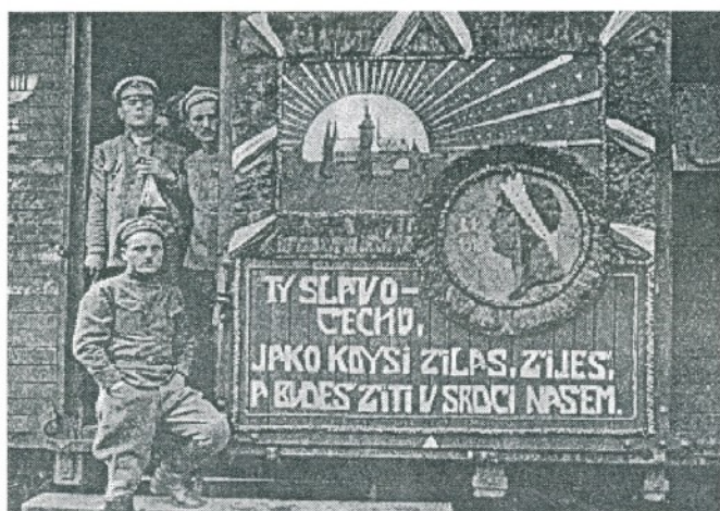
Výzdoba vagonů našich legií na Ukrajině

14. září před 60 lety zemřel první prezident ČSR Tomáš Garrigue Masaryk. Básník Vítězslav Nezval tehdy citlivě reagoval: "Tvé děti, oděné v smuteční stejnokroj, vědí, že čeká je dlouhý a těžký boj. Nedovol národu, aby dnes hlavu věšel." Druhý prezident ČSR dr. Edward Beneš zakončil svůj smuteční projev nad rakví TGM slovy: "Presidente Osvoboditeli, Vašemu odkazu věrní zůstaneme." Důstojným připomenutím Masarykovy osobnosti byl pořad České televize uváděný pod titulem "Ano, Masaryk" (Lze totéž říci o většině našich novin?) Svě zkušenosti a myšlenky zachytil v knihách Světová revoluce, Rusko a Evropa, Ideály humanitní, Otázka sociální atd. Mnohých z nich mají obecnou platnost i dnes a je dobré si je připomenout: "Nic není velké, co není pravdivé. - Kdo se dovolává svobody a práva na iniciativu, musí přiznat i osobní odpovědnost. "Já" je odpovědné, nikoli většina. To je mo-