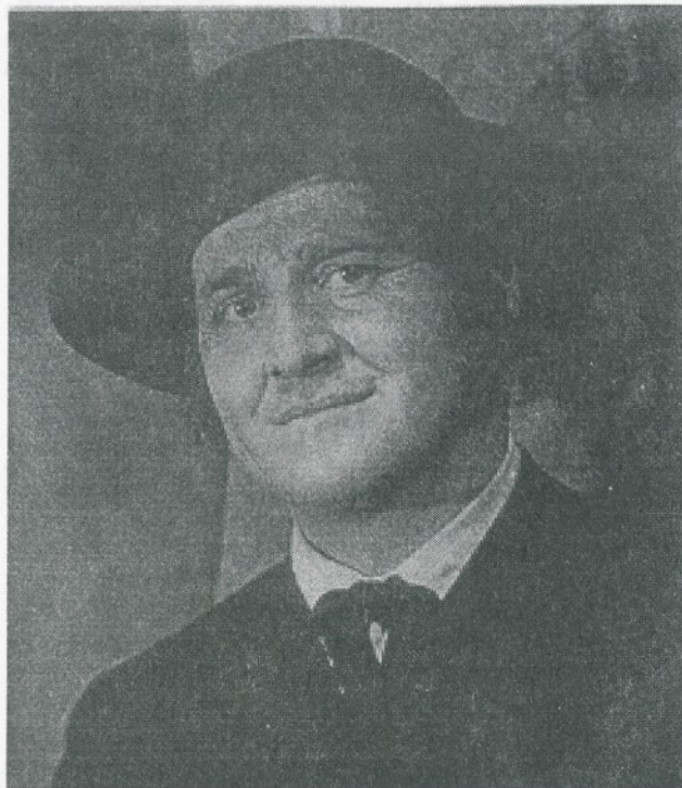
A jako učitel v dramatičce „Zapadlých vlastenců“

VV: Ano - titulní role v Posledním muži, John Worthing v Jak je důležité mítí Filipa, major Petkov v Čokoládovém hrdinovi.