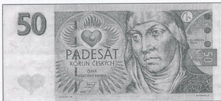
sv. Anežka Česká

Císařové němečtí odedávna usilovali oslabiti knížectví česká rozdelením moci jejich. Přemysl I. si obratnou politikou vůči německým Štaufům a Welfům zajistil obnovení královské hodnosti r. 1198 dědičně. (Poprvé ji získali pro svou osobu Vratislav II. r. 1085, podruhé Vladislav II. r. 1158.) Královskou hodnost uznali papež r. 1204 a Zlatou bulou sicilskou r. 1212 i římský panovník a král sicilský Fridrich II. Přemysl byl mezi říšskými knížaty nejsamostatnější a nejmocnější - byl jedním ze 7 kurfiřtů, kteří volili německého krále. (Palacký, Dějiny I, 68, 275 ad.)