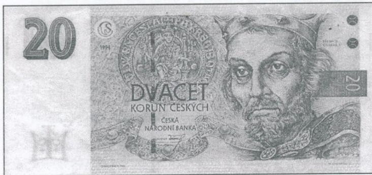
Přemysl Otakar I.

Císařové němečtí odedávna usilovali oslabiti knížectví česká rozdelením moci jejich. Přemysl I. si obratnou politikou vůči německým Štaufům a Welfům zajistil obnovení královské hodnosti r. 1198 dědičně. (Poprvé ji získali pro svou osobu Vratislav II. r. 1085, podruhé Vladislav II. r. 1158.) Královskou hodnost uznali papež r. 1204 a Zlatou bulou sicilskou r. 1212 i římský panovník a král sicilský Fridrich II. Přemysl byl mezi říšskými knížaty nejsamostatnější a nejmocnější - byl jedním ze 7 kurfiřtů, kteří volili německého krále. (Palacký, Dějiny I, 68, 275 ad.)