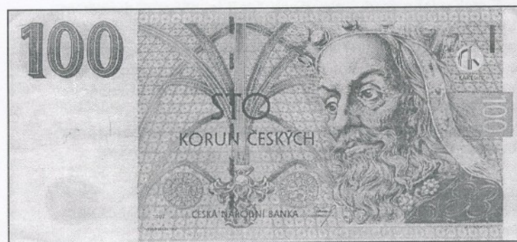
císař Karel IV.

Sv. Anežka Česká byla dcerou Přemysla Otakara I. V dětství byla zasnoubena se synem císaře Fridricha II. Jindřichem. Později vstoupila do kláštera, uvedla k nám řád františkánů a jeho ženskou odnož řád klarisek (se sv. Klárou si dopisovala) a založila jediný český řád křižovníků s červenou hvězdou. Svůj klášter otevřela chudým a nemocným. Za svou činnost byla tato česká princezna (1208-1282) v r. 1989 v Římě papežem Janem Pavlem II. svatořečena.