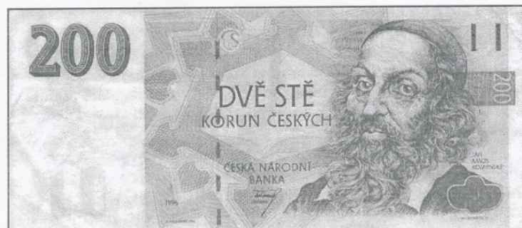
Jan Amos Komenský

Karel IV. se narodil r. 1316 jako syn Elišky Přemyslovny a Jana Lucemburského. Rozsáhlé vzdělání získal v Paříži a do vlasti se vrátil r. 1333. "Toto království jsem našel zpustošené... Pražský hrad pobořen... páni se stali tyrany a království si mezi sebe rozdělili." (Vita Caroli, vlastní životopis Karla IV.) Schopný, vzdělaný a sebevědomý dědic českého trůnu tvrdě zasáhl proti nespokojencům z řad šlechty, dosáhl povýšení pražského biskupství na arcibiskupství r. 1344, zvolen římským panovníkem r. 1346, korunován v Cáchách r. 1349, založil Nové Město Pražské a Universitu Karlovu r. 1348, Kamenný most, Karlštejn, stal se r. 1355 císařem a prvním mezi říšskými kurfirsty, český stát pak nejmocnější součástí říše.