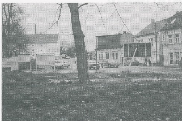
Stejně zdevastovaný byl i trávník mezi poštou a karlovarskou silnicí.

Víte, že povinností obce je zajistit zneškodňování Vašeho komunálního odpadu za Vaše peníze, ale i likvidovat „černé skládky“? Musím Vám sdělit, že v letech 1986 až 1988 bylo odvezeno kolem 80 nákladních aut odpadu, tedy kolem 500 m 3 . Nebyl to odpad z doby totality, jak mi někteří z Vás tvrdí. Byl to odpad z doby bezbřehé demokracie. Jsou lidé, kteří této době říkají i jinak, ale s nimi zásadně nesouhlasím. Snad 2x za 5 let někdo z občanů přišel a nahlásil mi odložení odpadu a číslo auta. Muselo však být to auto pražské. V tomto potvrzujete svou obdivuhodnou soudržnost. Není Vám z ní někdy až zle?