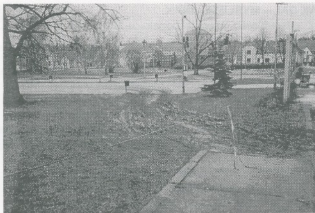
A takhle dopadla část parku, přes který jezdili neukáznění řidiči, převážně místní občané.