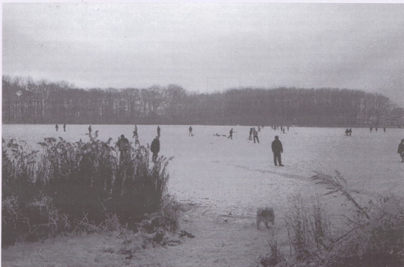
Na přelomu roku děti i dospělí bruslili na zamrzlé ploše Litovického rybníka

NAJDETE UVNITŘ: * Zprávy z radnice - z jednání městského zastupitelstva a městské rady * Obchvat Hostivice v nedohlednu - vyhlašuje se PETIČNÍ AKCE - čtěte na str. 4 * Technické služby informují o způsobech a termínech sběru odpadů * Představuje se Lesní školka ARNIKA * * Místopisný průvodce po Hostivici aneb „Kde to je, když se řekne ...“ * * Žili mezi námi * Dětské oddíly * K daňovým přiznáním * Kopaná - ve vzpomínkách i v současnosti * Policejní deníky* Pozvání na plesy *