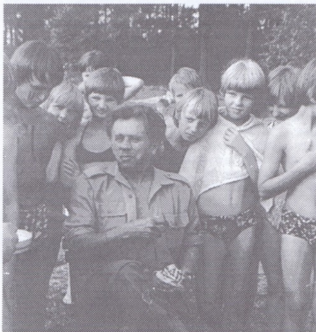
Hogan byl s dětmi kamarád, ale s velkou autoritou.

Pro srovnání - v roce 1970 bylo 40 dětí ve 3 oddílech, v roce 1978 již ve 20 oddílech pracovalo 360 dětí. Ve spolupráci s oddílovými vedoucími byly pro děti připravovány zajímavé akce a pravidelně se konaly letní tábory.