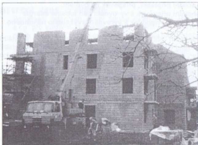
Stavba Domu s pečovatelskou službou v Pelzově ulici - (nad kostelem) - foto ze dne 16. února 2000

Dokončení stavby podle předaného harmonogramu dodavatele je 30. září 2000. Stavba probíhá přesně podle harmonogramu a lze předpokládat, že termín bude dodržen.