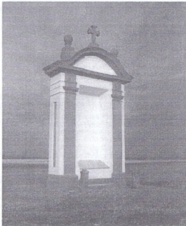
Rok 1999 - opravená kaplička v plné kráse, škoda, že snímek nevidíte v barvách!

Henryho Forda, nedostali jsme nic - o to větší překvapení. Smlouva zněla na 350 000,- Kč. Abychom je dostali, stála před námi nová smršť naléhavých úkolů. Výběrové řízení, hodnotící komise, její doporučení, rozhodnutí o dodavateli, vyjádření všech majitelů slabo - i silnoproudých kabelů, totéž od Transgazu. Připočtete-li k tomu předcházející porady, pátrání na katastrálním úřadě, jednání s uživateli pozemků atd., hezky se to čte, ale při vzpomínce na průběh budí dojem hrůzného snu. (Poznámka: Získali jsme dobré zkušenosti s ochotnou státní byrokracií a nejhorší zkušenosti s úředníky mamutích soukromých podniků!)