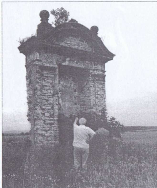
Takto zchátralý byl stav kapličky č. 19 v roce 1998.

západními větry hluboko do spár, v maltě labyrint chodbiček mravenců nevidané velikosti, pod kapličkou spleť nor lišek, na střeše kapličky bezmála březový remízek, to vše uprostřed širého lánu, co kolem kapličky oboráno, zarostlo náletovými keři a plevelem. Zdálo se, že nic obě ubohé kapličky neuchrání osudu jejich dvou sester na začátku cesty.