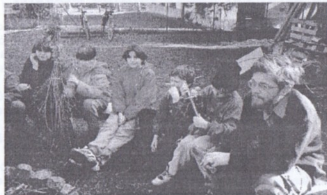
Posezením u ohně se děti loučily se zimou a přivítaly jaro.