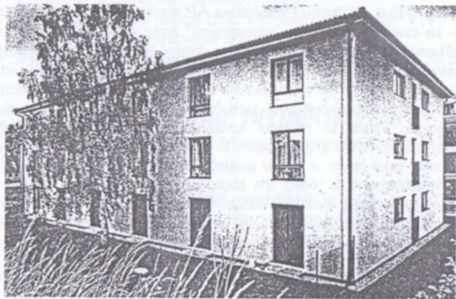
Pohled na dům „C“

Výměra dvou menších typů bytu - 31 a 42 metrů čtverečních - o několik metrů překračuje parametry zákona o sociálním bydlení z roku 1936 (24 a 34 m 2 ), podle kterého postavila první republika nejvíc svých vlastních malometrážních bytů. Třetí typ o 62 metrech čtverečních pak zhruba odpovídá ploše třípokojového bytu v panelovém domě. Místnosti ve všech bytech mají dobré proporce a jejich prostor lze promyšleně využít i zabydlet.