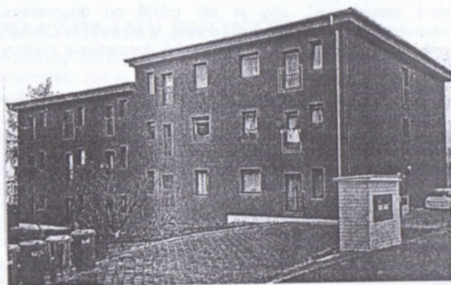
Dva bytové domy ve Školské ulici

Koncept, který uplatnili u čtveřice domů družstva Cihlářka při Zimní ulici, si už architekti asi před dvěma lety vyzkoušeli u dvou dalších domů v Hostivici v ulici Školské.