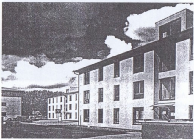
Pohled na malé náměstí s rohovými ulicemi

Architektura domů v Zimní ulici připomíná pozdní funkcionalismus dvouletky i její skandinávské vzory ze čtyřicátých let, pro něž Nikolaus Pevsner kdysi razil heslo "nový empirismus", aby je tak odlišil od dogmatismu pravověrně funkcionalistických směrů. V sousedství Cihlářky koneckonců narazíme i na autentické dvouletkové budovy.