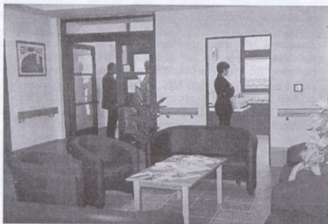
Vybavení vstupní haly v přízemí