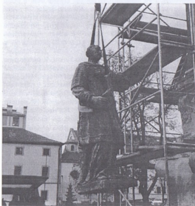
Sv. Vít taktéž putuje zpět na tělo sloupu.

Připomeňme si ještě alespoň ve stručnosti historii Mariánského sloupu. Postavit jej dala velkovévodkyně Anna Marie Toskánská nejspíše v roce 1734. Plastická výzdoba se skládá z paladia na vrcholu sloupu a čtyř soch světců na těle sloupu, sv. Víta, sv. Kateřiny, sv. Vavřince a sv. Floriána. Na paladiu směrem k faře je zobrazena patrně modlící se Anna Marie Toskánská, na straně směrem k zámečku je v nízkém reliéfu znázorněn bělohorský obraz. Boky jsou zdobeny akantovým listem, který pak přechází v květinový motiv.