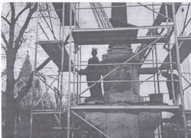
Dáma dostala přednost - na své původní místo se sv. Kateřina vrátila jako první! Bylo právě poledne dne 26. října 2000.