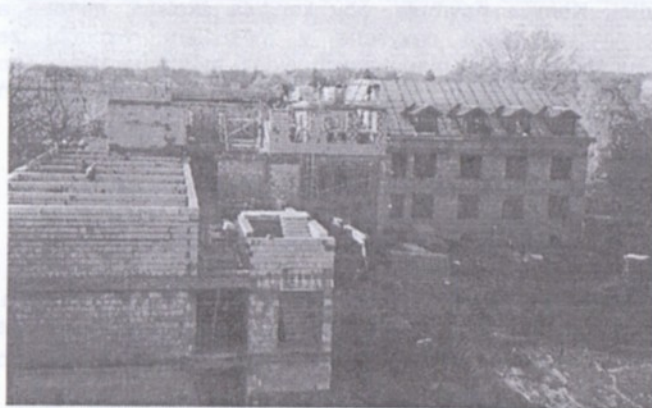
Takto již pokračovala stavba Domova důchodců - pro srovnání, spodní snímek je z počátku srpna

Na den 3. listopadu 2000 je stanoven termín kolaudace objektu, aby po odstranění případných závad, mohl již být postupně zahájen provoz tohoto domu.“