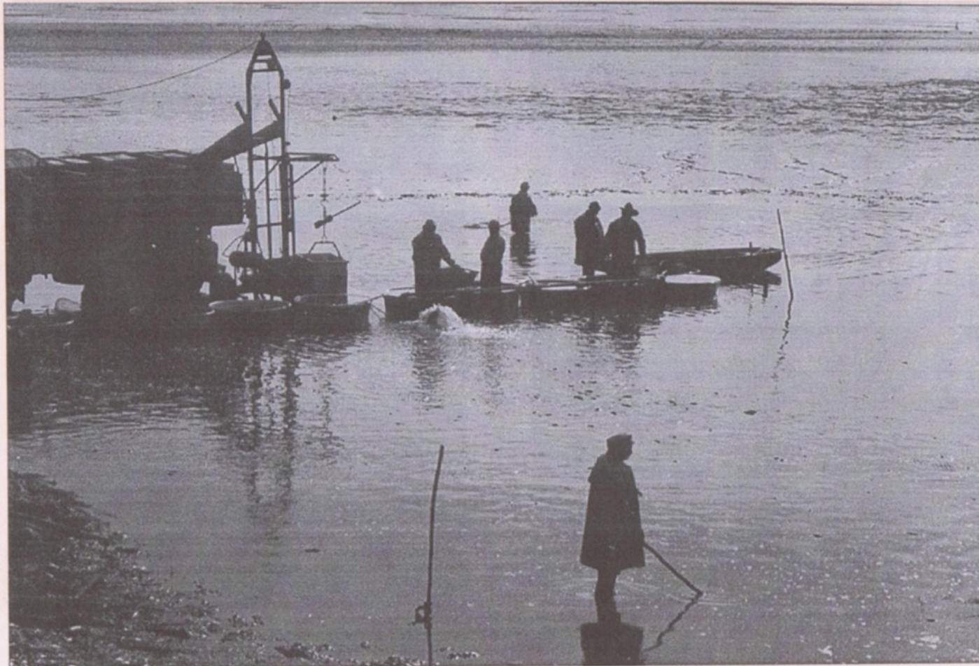
Výlov Litovického rybníka - 16. října 2000

NAJDETE UVNITŘ: Fotoreportáž ze slavnostního otevření Domu pečovatelské služby * Zprávy z radnice * Upozornění na nová práva občanů * * Pozvání na veřejné zasedání zastupitelstva * Představujeme Hostivické lazebnictví * Radí a informuje ARNIKA * Nepodceňujte chřipku - doporučují lékaři* * Mariánský sloup opět zdobí náměstí * Zprávy ze školy * Centrum drogové prevence zve na besedu s odborníkem * Připravují se „Milulášské“ pro děti i pro dospělé - a též vánoční koncert na zámku * Policejní deníky * * Společenská kronika *