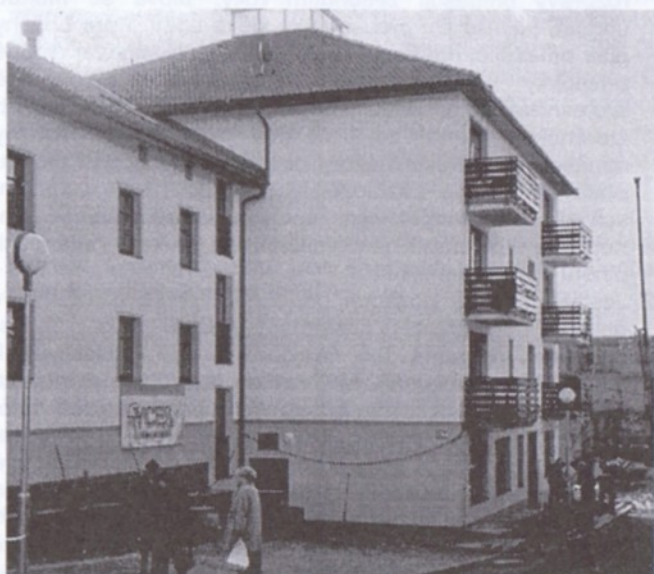
Pohled na DPS z úpatí Pelzovy ulice