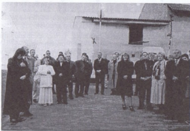
A ostatní účastníci slavnostního otevření