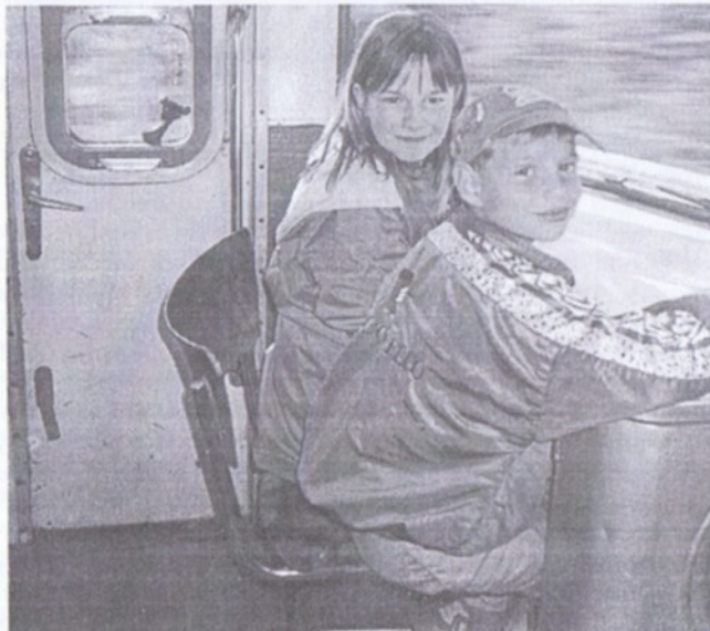
Cestou do Českého krasu

Ohlas měly výpravy do depa kolejových vozidel Vršovice, do Českého krasu. Každoročně, tedy i letos se uskutečnila cílová jízda na kole do Lidic.