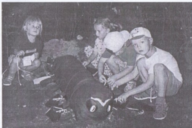
Na jiném místě pak děti obouvaly stonožce botičky.

O týden později, jako každý rok, organizovaly Kajky podzimní pomoc přírodě. Uklidili jsme od odpadků les kolem Kaly, Stromečky, hráz Litovického rybníka a odpoledne jsme nařezali dřevo na topení do klubovny.