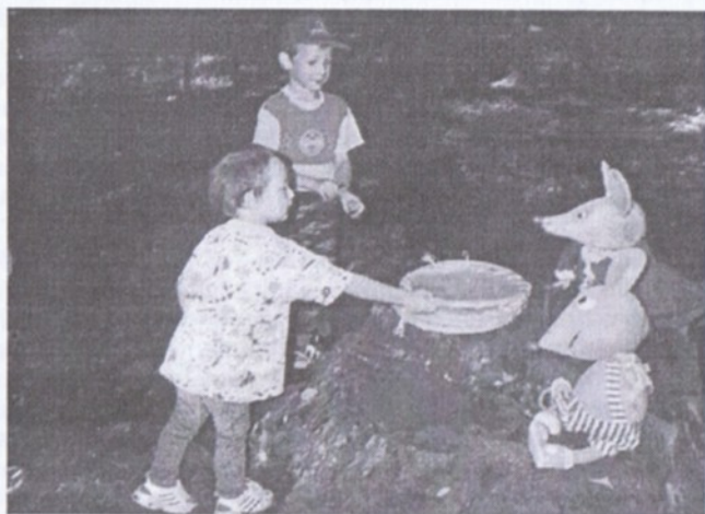
Takhle veliký kulatý sýr přinesly děti myškám.

V září pořádal Pionýr pro všechny hostivické děti Pohádkový les. V Bažantnici si dali dostaveníčko Beruška, Ferda mravenec a Brouk Pytlík. Pozvání přijal i Krtek v kalhotkách, Šneček - ochránce přírody, parádívá Housenka a malá Ptáčátka. Dětem se líbilo pomáhat Pavoučkovi tkát sítě, nosit sýr Myškám a také obouvat Stonožce botičky. Po skončení se děti rozešly do svých domovů a broučkové a ostatní postavičky se mohly vrátit do své pohádkové říše.