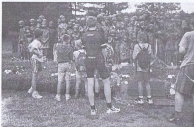
U památníku v Lidicích

Ti nejstarší poněkud v drsnějších podmínkách sjeli řeku Sázavu. Byly i další akce. Letos se opět jako každý rok vykročilo z Prahy do Karlštejna. Skauti a jejich příznivci uskutečňují tento pochod každý rok, vždy první sobotu po Památce zesnulých v listopadu. Kdo má chuť může s námi příští rok ujít také 30 km.