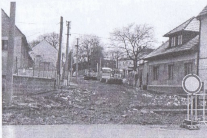
Rekonstrukce Jiráskovy ulice započala v polovině března a dokončena by měla být v polovině dubna.