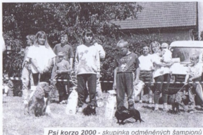
Psí korzo 2000 - skupinka odměněných šampionů

Samozřejmě, že již mají hostivičtí chovatelé stanoven termín i letošní Tradiční červnové výstavy . Ta se bude konat v sobotu a neděli 16. a 17. června 2001 a její součástí bude hojně navštěvované a oblíbené „PSÍ KORZO“ . Nenechte se ujít toto milé představení, jehož začátek se uskuteční v sobotu 16. června od 14.00 hodin.