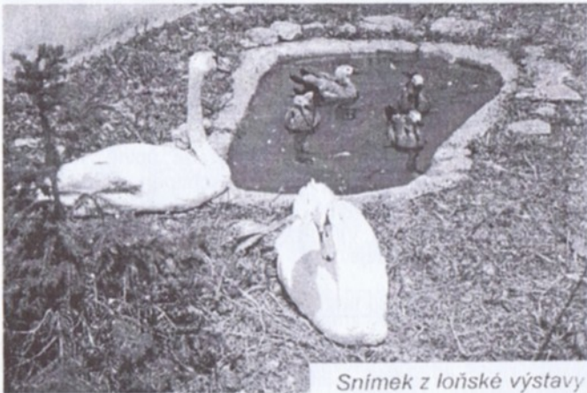
Snímek z loňské výstavy