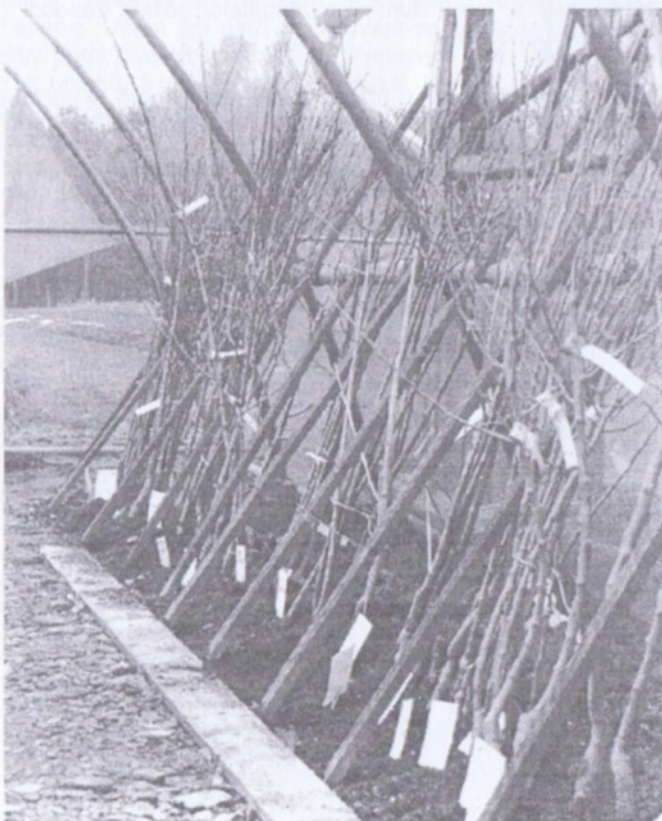
Srovnání jak vojáci - čekají ovocné stromky na své nové pěstitele.

Opět jsme zvolili kmenný tvar zákrsků, který je u tohoto druhu ovocných stromů zákazníky nejžádanější.