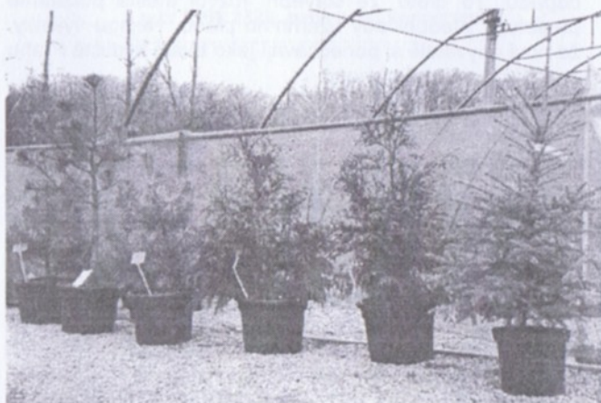
K výsadbě jsou tu připraveny i kontejnerované jehličnany.