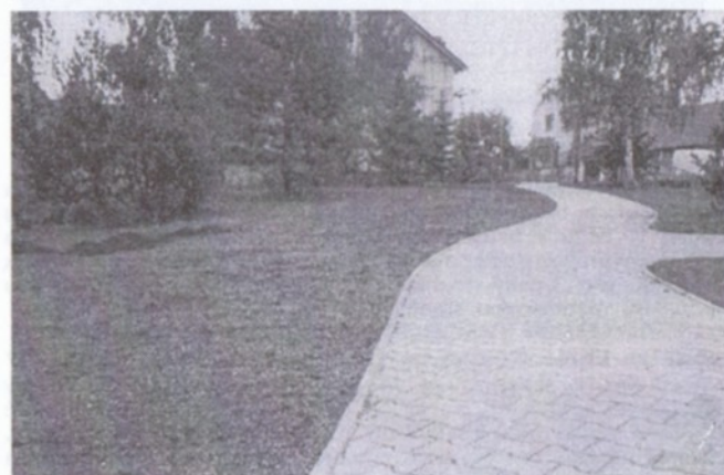
Úprava parku ve Zbuzanech

Pokud budete mít zájem o naše služby, ozvěte se včas. Podzimní realizace vyžaduje projektovou přípravu již v létě, stejně tak práce na jaře se musí připravovat již v zimě.