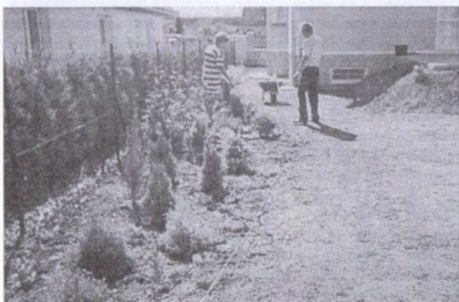
Zakládání zahrady u rodinného domu