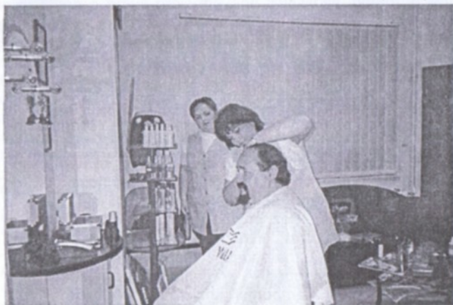
Poznáte tohoto našeho zákazníka?