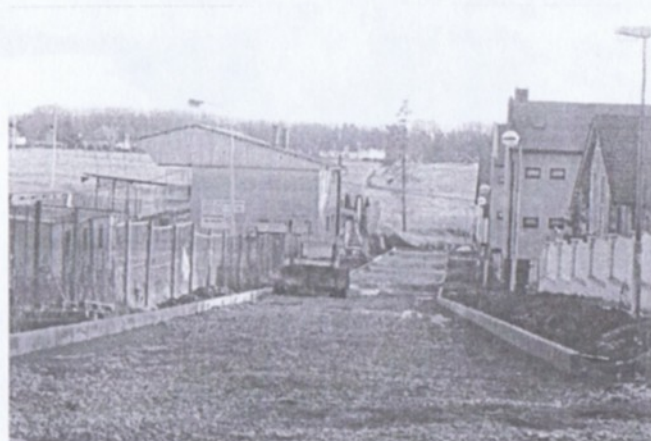
Ulice U Stadionu – 25.1.2002