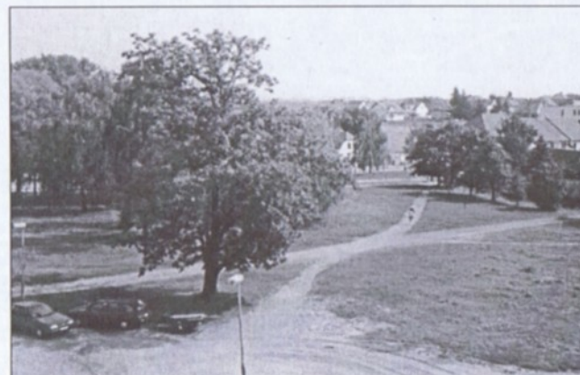
Současný stav jižní části Husova náměstí