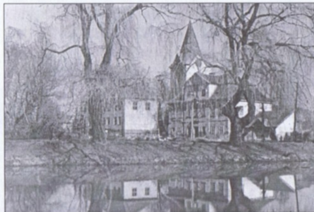
Rybník Selský – foto z počátku 50. let