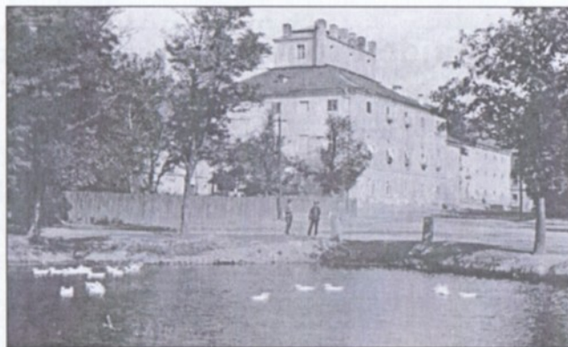
Rybník zvaný Panský – foto z roku 1935

Současný stav náměstí je značně neuspokojivý. Náměstí se vyvinulo z hostivické návsi a nikdy nebylo koncepčně přetvořeno tak, aby odpovídalo svému novému významu. Nejméně uspořádaná je jižní část náměstí, která nebyla po zavezení dvou rybníků řádně upravena.