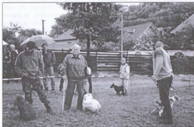
Snímek z loňského „korza“ - adepti na vítěze v kategorii menších plemen