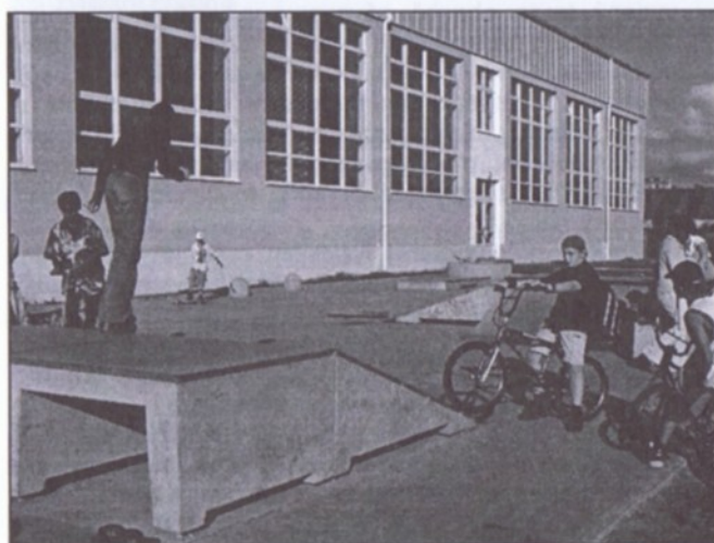
Své stálé návštěvníky již má dětské hřiště u nové školy a hojně využívaná je též betonová plocha, osazená prvky pro skaet.