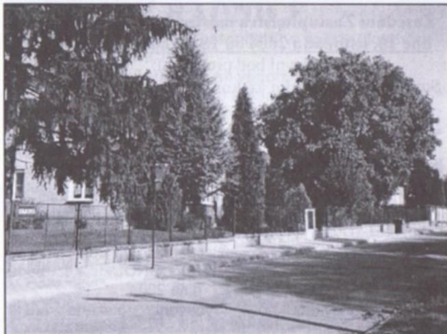
Náhradou za dočasné užívání vozovky Sadové ulice pro stavební dopravu firma Central Group, a.s. vybudovala v této ulici chodník