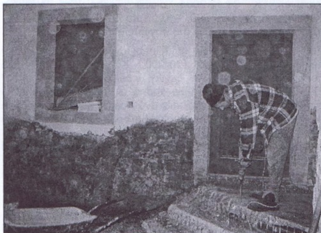
- Práce v zadní hale v přízemí - 16.2.2005

Pro zprovoznění zadního vstupu (historicky doloženého hlavního vstupu) do zámecké budovy je nutné provést rekonstrukci podlahové krytiny. Byla odstraněna kabřincová dlažba, podkladní vrstvy betonu a heraklitové desky (vlhkem velmi nasáklé). Na štěrkovou vrstvu jsou ukládány