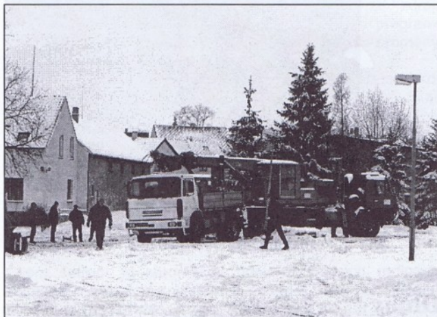
Firma RISL, s.r.o. pokračuje v rekonstrukci splaškové kanalizace na Husově náměstí - 23.2.2005