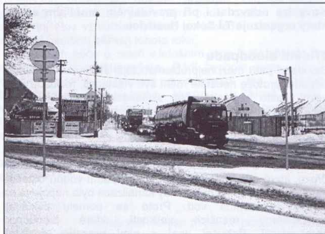
Zbavíme se průjezdu těžkých kamionů středem města?

Ale kolikanásobně se zvýšil provoz a tedy i potíže popisované již před 28 lety? Vracíte-li se z nákupu od prodejny „Lidl“, napočítáte kolem 200 automobilů během deseti minut (sledováno kolem 18. hod.). K smíchu jsou mi dost často v televizních zpravodajstvích šoty z různých míst republiky, ve kterých se občané dožadují zrušení dopravy v některých částech jejich města, protože prý „tudy projedou až stovky automobilů denně.“ Srovnajte to se stavem u nás! Kolik je to tisíců nebo možná desítek tisíců?