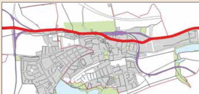
Mapka Hostivice s vyznačením trasy koněspřežky (silná červená čára) a současné železnice (fialové plochy)