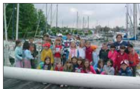
Zájezd do Itálie