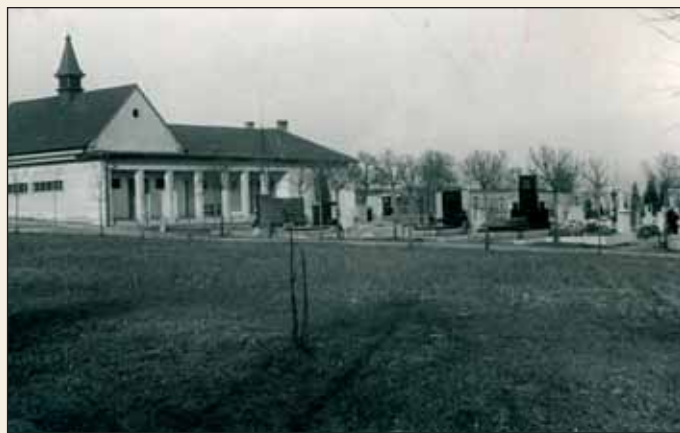
Současný hostivický hřbitov po dokončení

Na levém náhrobku je patrný kalich, který dokládá kališnickou víru zemřelého.