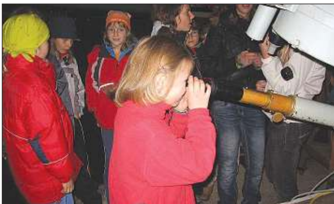
podzimky - hvězdárna

zkoumali. Kromě toho jsme zvládli podívat se na kopec Spravedlnost i na oba Blaníky, prohlédli si vlašimskou záchrannou stanicí pro zraněné živočichy i zámecký park, pozorovali Jupiterovy