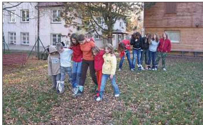
výročí - klání

Hra na podzimních prázdninách nás zavedla na vesmírnou expedici ke vzdálené planetě. Cvičili jsme se jako kosmonauti, letěli jsme vesmírem a hlavně jsme cizí planetu pořádně pro-