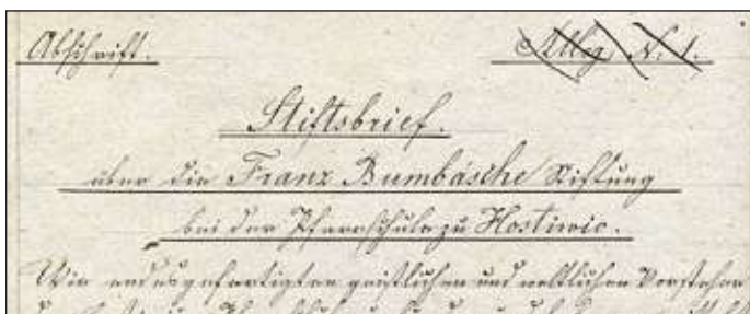
Německy psaný nadpis Bumbovy nadace a podpisy pod nadační listinou z roku 1852

Ekartshausna. Dále se rozdalo mezi pilné žáky 40 velkých a 15