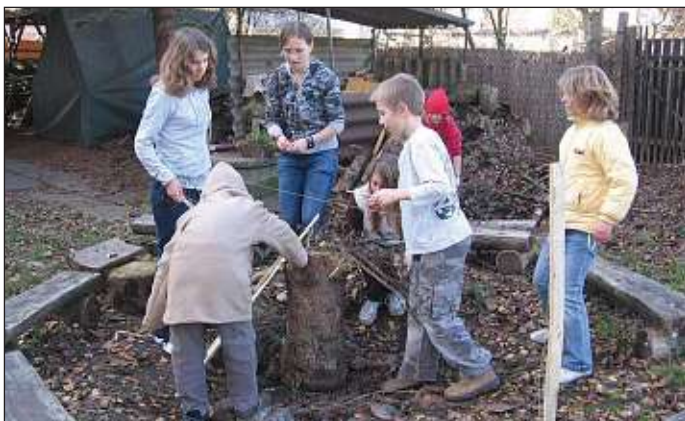
výročí - klání