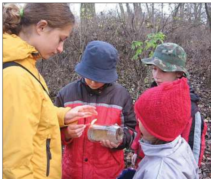
výročí - úmluva

Na konci listopadu se podílíme na hostivickém světélkování a v prosinci nás čeká den lidových řemesel a samozřejmě vánoční schůzka.