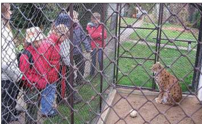
podzimky - záchranná stanice

poněkud ulehčili situaci. Na tvarohových hodech i při setkání bývalých členů jsme se dostali i k prohlížení našich mnoha kronik. Škoda jen, že se pro nedostatek času nepovedlo podle plánu pozvat všechny dřívější členy - snad to napravíme při dalším výročí. V pondělí 17. listopadu, přesně na výročí, jsme oslavy završili návštěvou stromu úmluvy. K listinám uloženým bezpečně ve sklenici s víčkem zalitým voskem jsme přidali další záznamy.