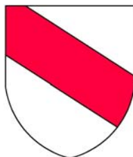
Chrtové ze Rtína