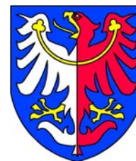
Žďárští ze Žďáru