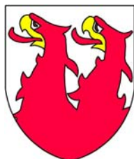
Rod z Jenštejna