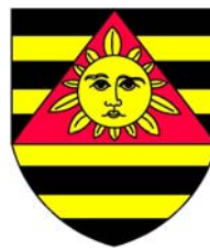
Kutnauerové ze Sonnensteinu